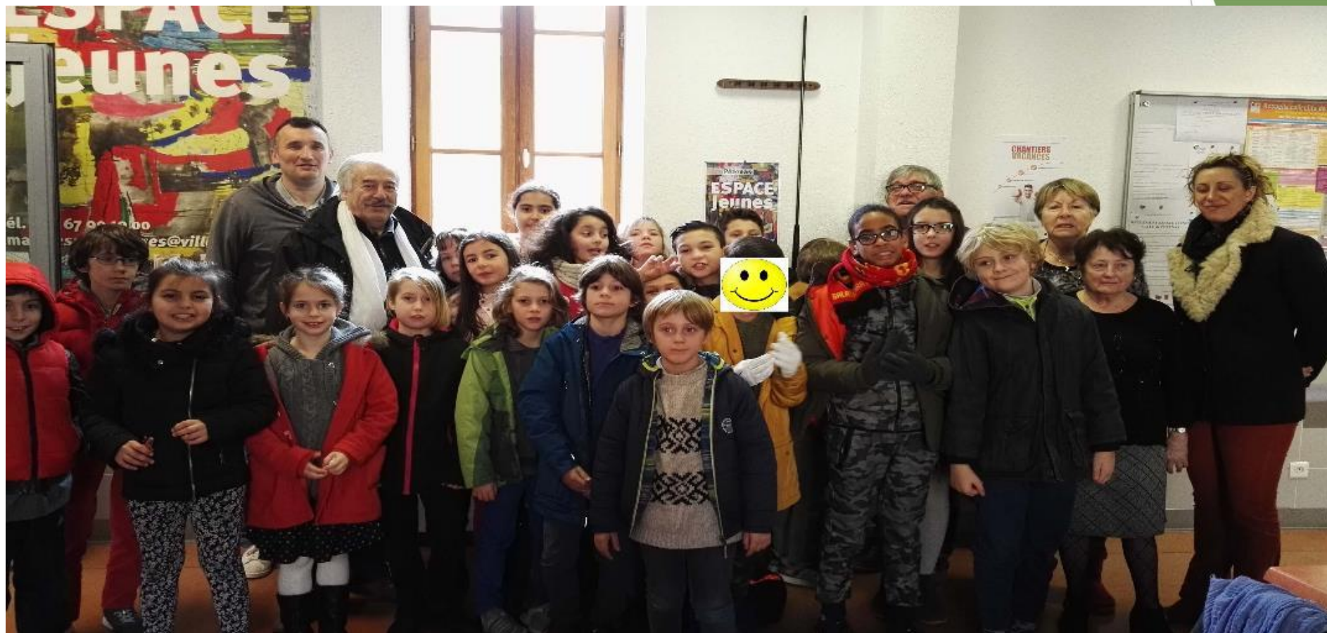
Congrès UDCCAS 12 juin 2018