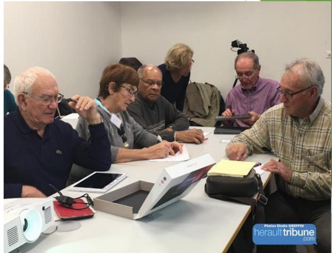
Congrès UDCCAS 12 juin 2018